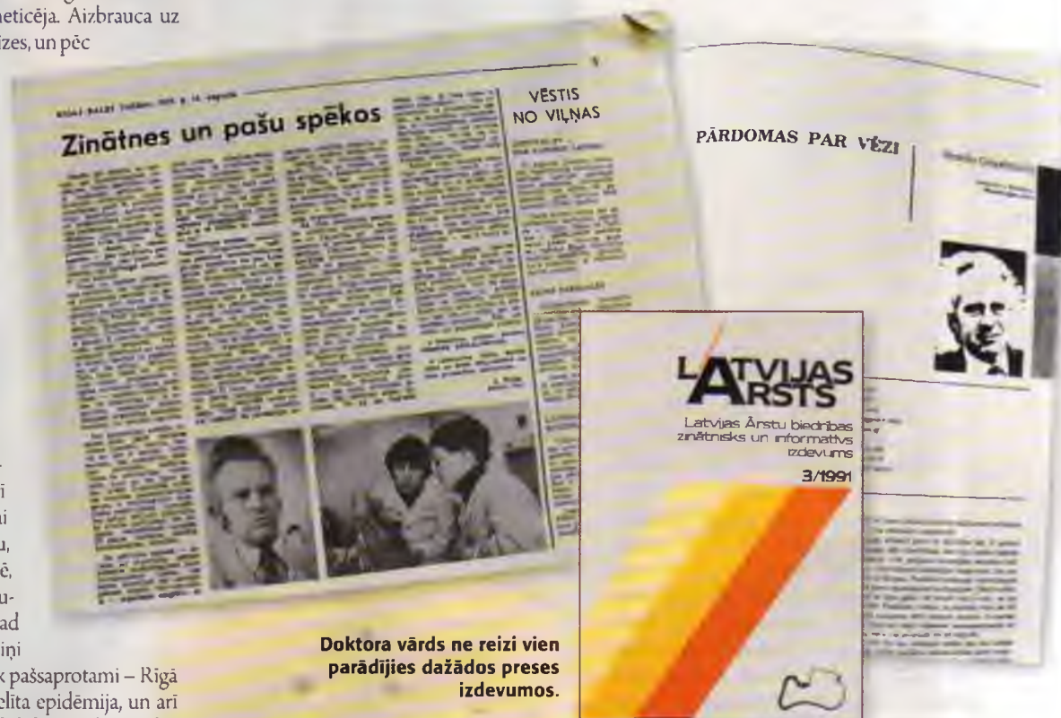
Doktora vārds ne reizi vien parādījies dažādos preses izdevumos.